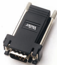
WX Adapter für WFE / WHP