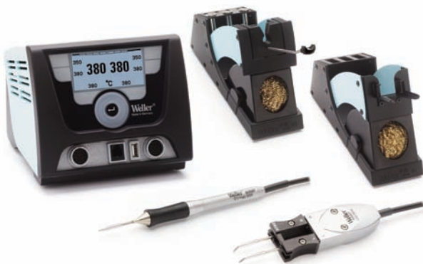
WX 2 Lötstation mit WXMP Mikro-LötKolben &amp; WXMT Entlötpinzette