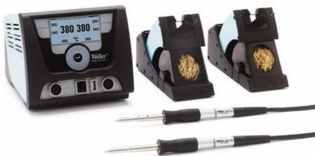
WX 2 Lötstation mit 2 WXP 120 LötKolben