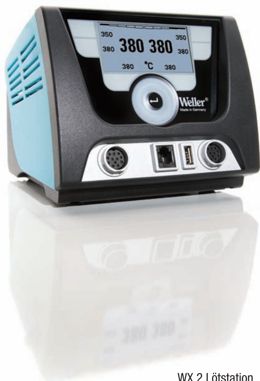
WX 2 Lötstation