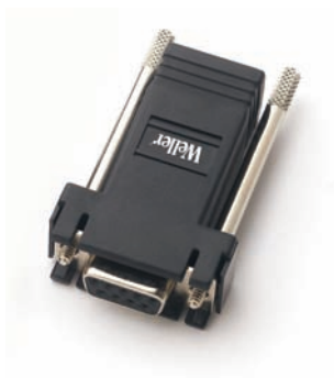
WX Adapter für PC