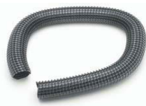
5 87 353 27 Absaugschlauch 50mm