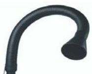
5 36 372 99 WFAF 50 Absaugarm